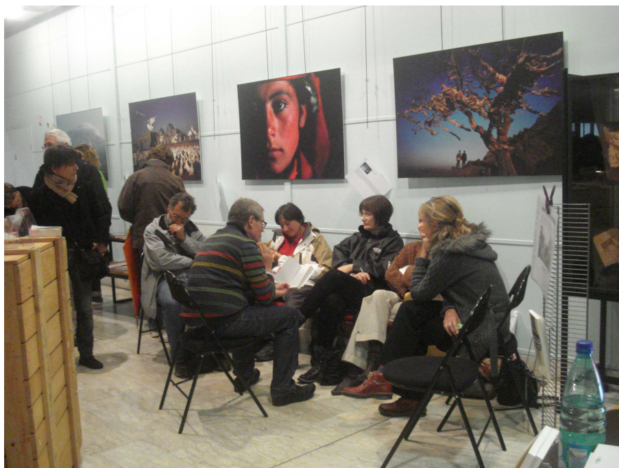
Une lecture à voix haute pour public attentif