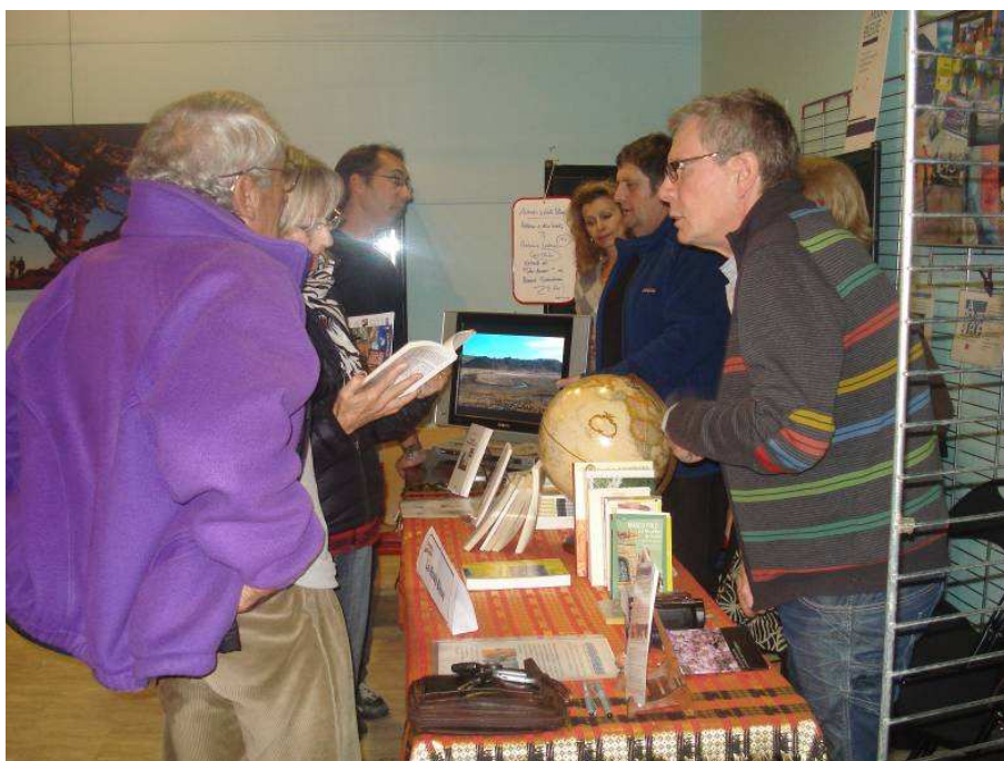
La Route Bleue informe...